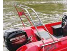
ステンレスフレーム